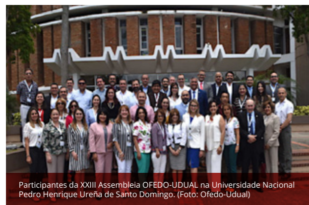
Participantes da XXIII Assembleia OFEDO-UDUAL na Universidade Nacional Pedro Henrique Ureña de Santo Domingo.

O compromisso da LAOHA com a OFEDO continua e os próximos passos já seguem sendo discutidos para contribuir desde a faculdade com a saúde bucal.