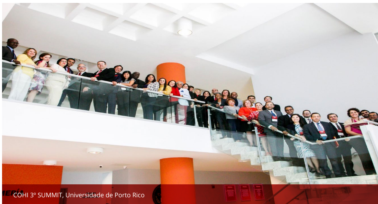
COHI 3º SUMMIT, Universidade de Porto Rico

de países do Caribe e da América do Sul. Sessões interativas facilitaram o intercâmbio de experiências e estratégias sobre como estabelecer políticas públicas essenciais para promover a saúde bucal em populações carentes e eliminar as disparidades de saúde na região. Durante o SUMMIT , os participantes compartilharam novos desenvolvimentos em pesquisa, consenso curricular sobre cárie e programas comunitários e escolares, prevenção e promoção da saúde bucal e estratégias baseadas em evidências.