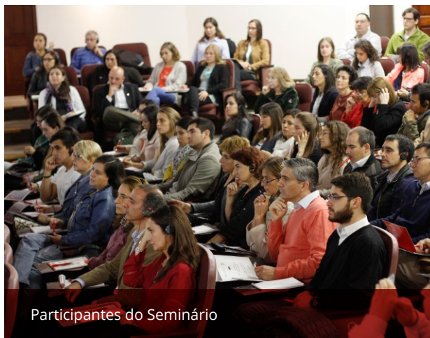
Participantes do Seminário