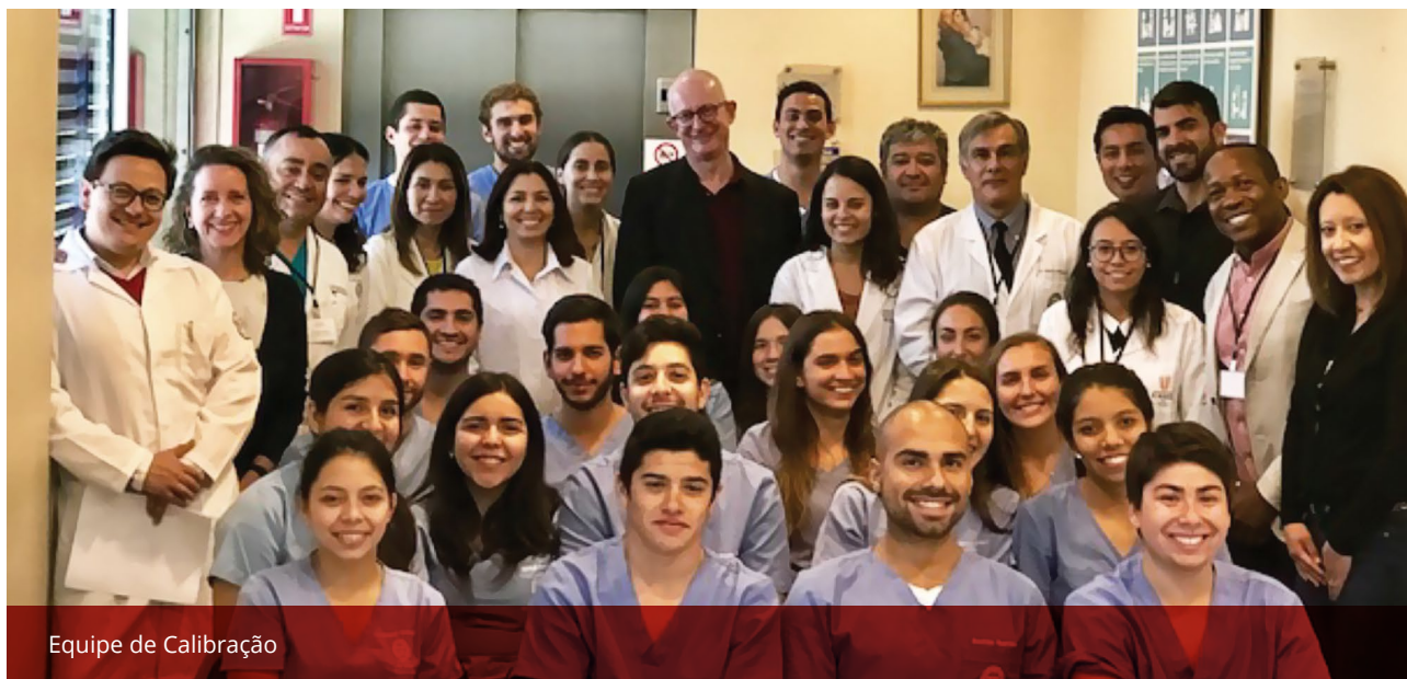
Equipe de Calibração