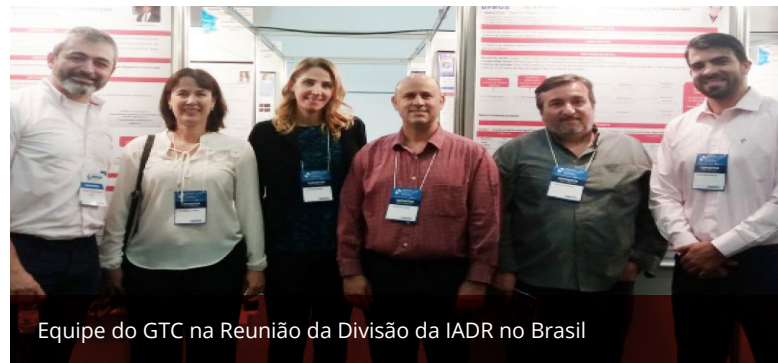
Equipe do GTC na Reunião da Divisão da IADR no Brasil

Além da atividade no CIOSP, a equipe também teve a oportunidade de visitar a reunião da SBPqO (Sociedade Brasileira de Pesquisa Odontológica), que representa a Divisão Brasileira da International Association for Dental Research – IADR. Atualmente é a maior divisão na América Latina e uma das Divisões mais representativas da IADR no mundo. As Reuniões da SBPqO se consolidaram como o evento mais importante em pesquisa do país na área odontológica com cerca de 4000 participantes anualmente.