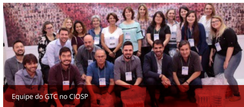
Equipe do GTC no CIOSP